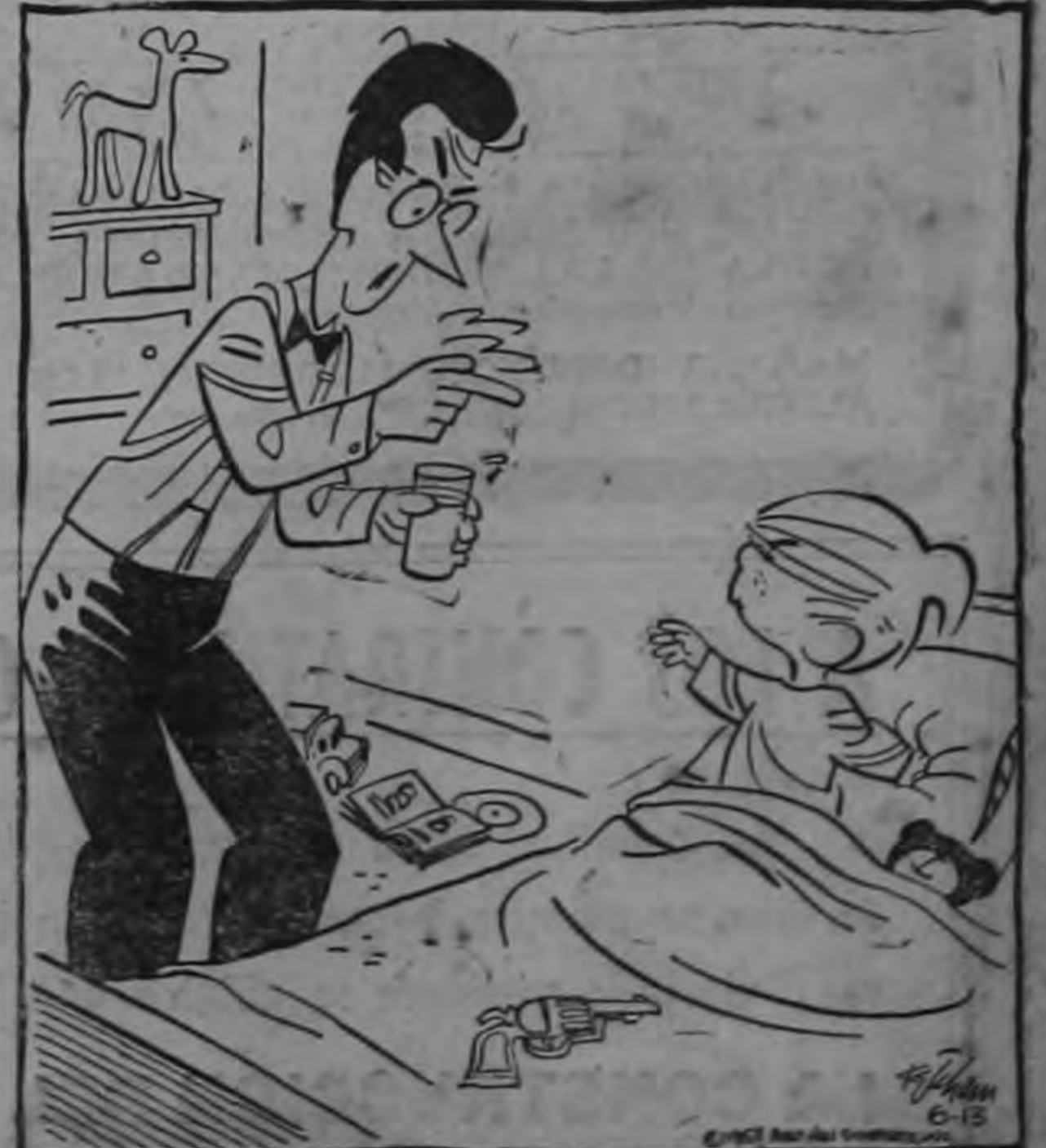
La próxima vez que grites: "¡Que venga el aguador!", no te traigo agua, Me oiste?