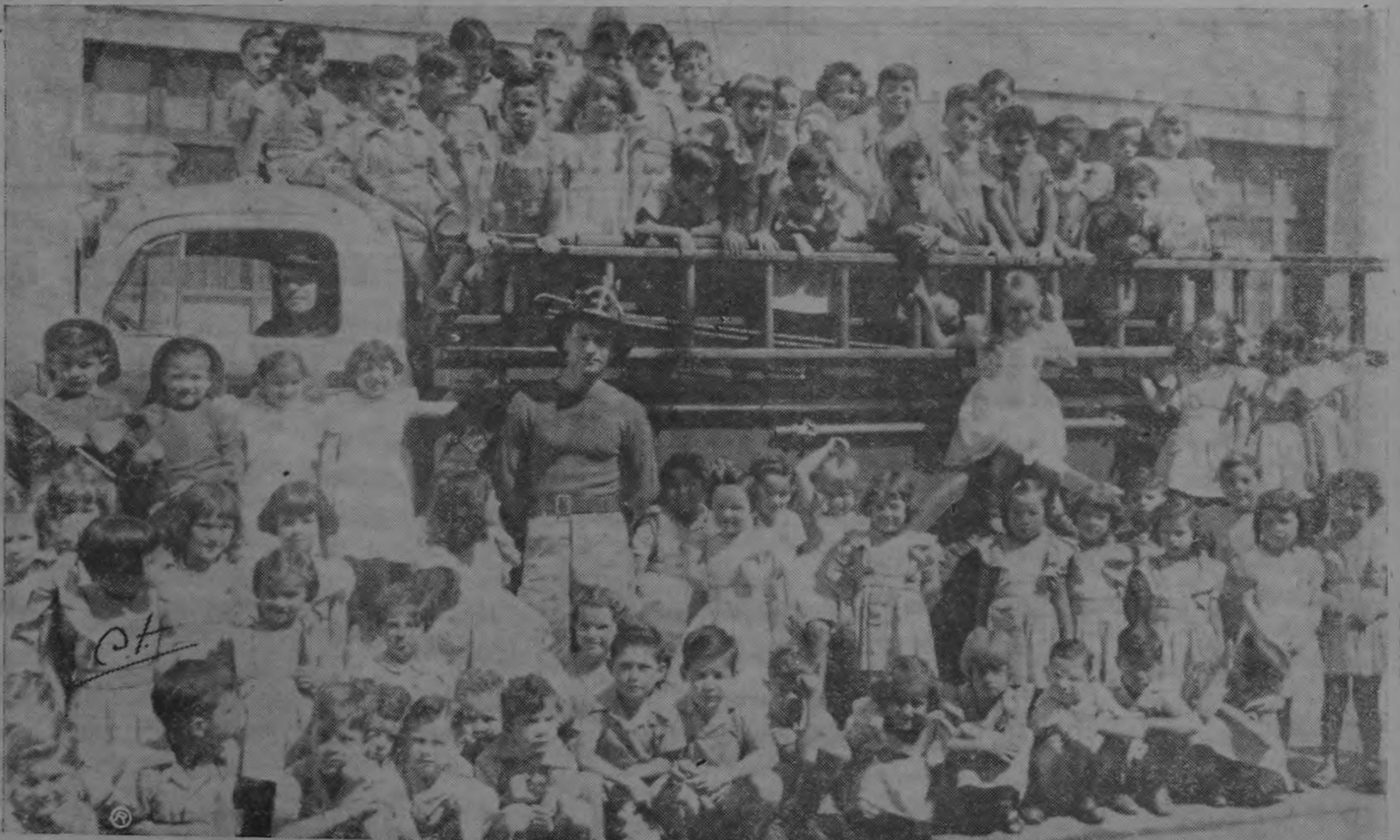
¡DEJAD A LOS NIÑOS QUE VENGAN A MI!—Esta hermosa escena se registró ante el local de la Escuela García Flamenco: los niñitos del Kinder Arturo Urién están encaramados sobre uno de los carros del servicio de bomberos. Así, los chiquitos tienen oportunidad de conocer de cerca al personal y el equipo, y hasta conversar un poco sobre lo que hay que hacer cuando estalla un incendio, por lo menos, la reunión es un motivo de alegría para los pequeños. Y eso ya es bastante.